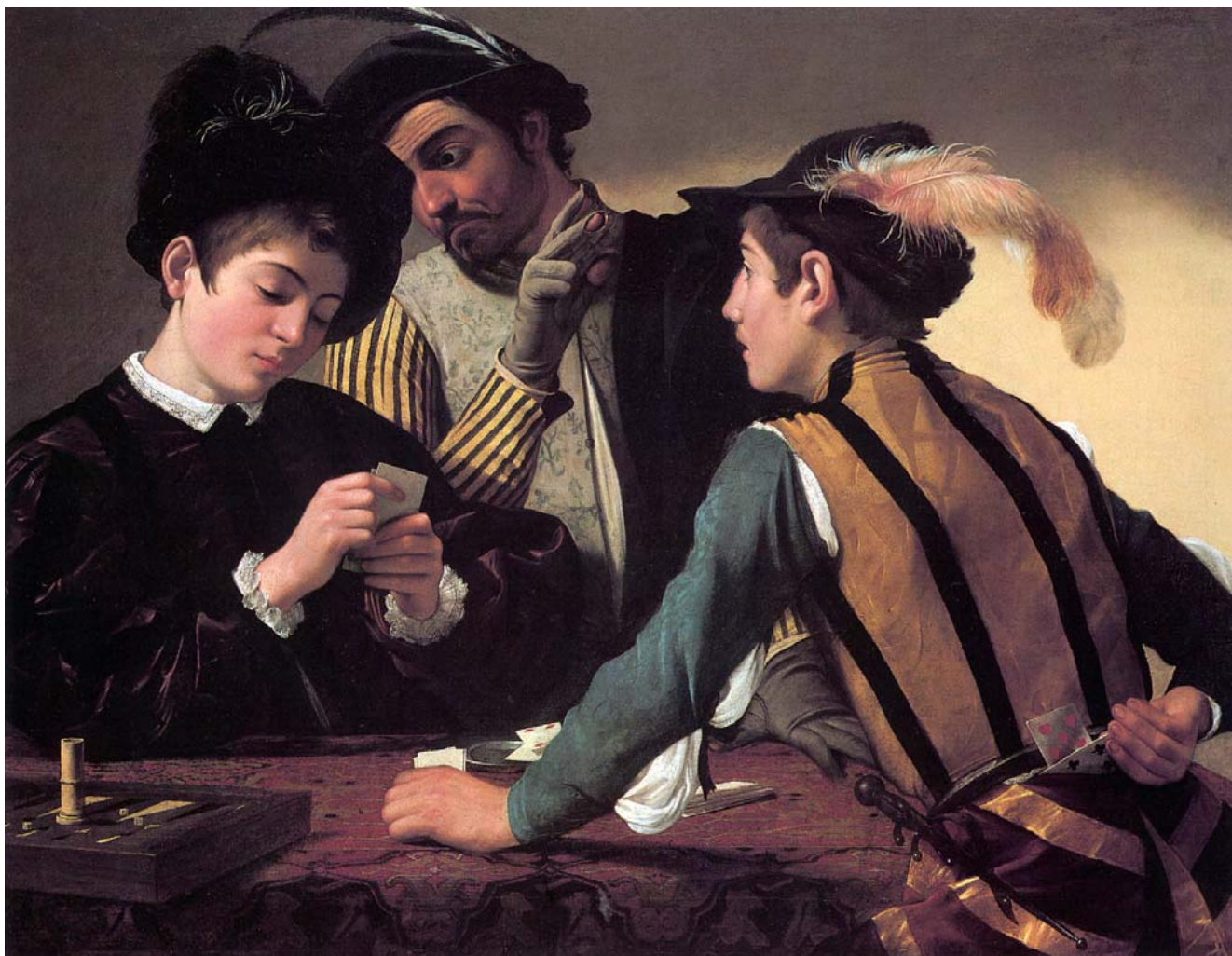
I bari , Caravaggio