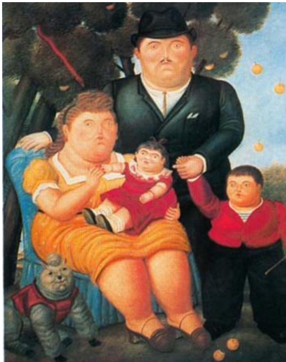
La familia , Fernando Botero