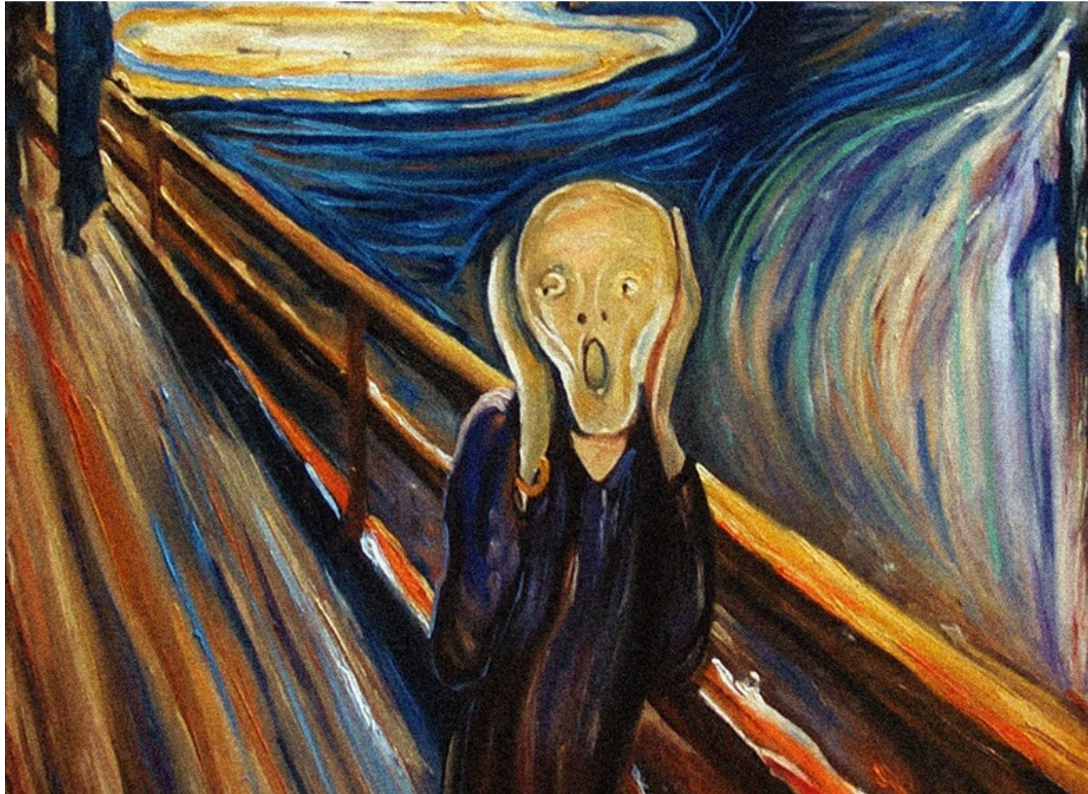
The Scream, Edvard Munch